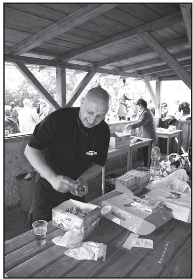
Není to příjemná změna, když strážníci místo pokut rozdávají bonbonky?