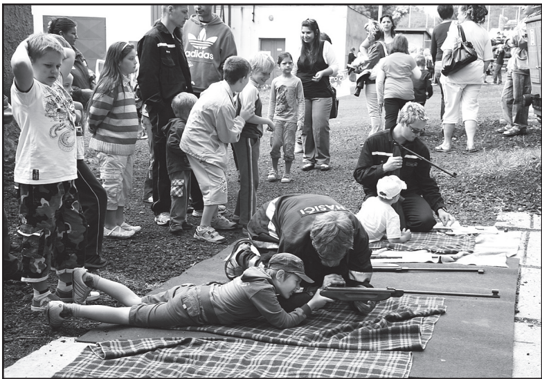
Zalehnout, zamířit, vystřelit - to bylo něco pro kluky! Se zajištěním střelby ze vzduchovek pomáhali strážníkům hasiči.