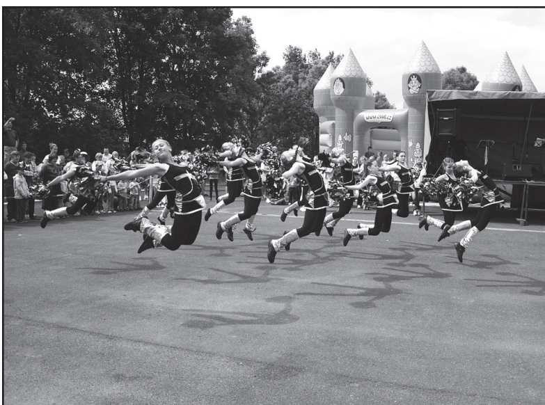
Při tanečním vystoupení je důležité dokázat odpoutat se od svého stínu - to mají Rozalinky z jirkovské zušky zmáknuté.