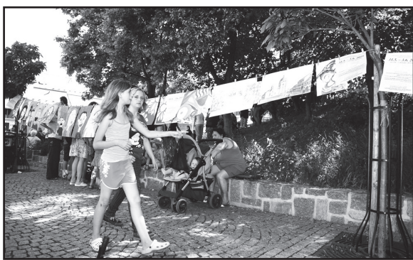
Výtvarný obor vytvořil pro svou prezentaci open-air galerii.

A co bylo k vidění a slyšení? Výtvarný obor se prezentoval galerií prací svých žáků, která byla nainstalována ve směru od centra dění ke kinu. Vlastní tržiště pak patřilo muzikantům, jak sólistům, tak hudebním seskupením, ale asi nejatraktivnější byla taneční vystoupení od nejmenších minimažoretek po juniorky. Bylo to příjemné zpestření všed-