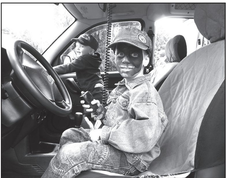
Pozor, mluví k vám městská policie! Zatýkám vás!