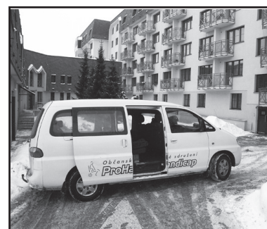
Vůz, kterým o. s. Prohandicap zajišťuje svoz dětí do škol.

Předpokládané výdaje občanského sdružení pro rok 2011 činí 140 000 korun, přičemž v oblasti příjmů figurují jen sponzorské dary v řádu tisíců korun (vloni 5 000, letos 12 000) a poplatky za svoz dětí od rodičů (předpokládaný letošní příjem 30 000 korun pokryje přibližně pětinu celkových výdajů). Bez příspěvku města by tak své aktivity nemohlo vykonávat.