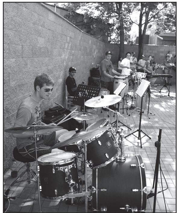
Jedním z hudebních seskupení, které ukázalo, co umí, byla skupina žáků bicího oddělení.

niho odpoledne, které možná některé z přihlížejících inspiroje, kam nasměrovat mimoškolní aktivity své ratolesti. „To je ostatně jeden z důvodů, proč tuto prezentaci pořádáme,“ připouští M. Sailerová a zároveň dodává další, neméně podstatný. „A pak, děti pochopitelně také chtějí ukázat to, co umí.“ Co se týče druhého důvodu, ukázaly, že rozhodně mají