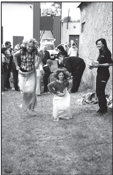
Tak co mámi, kdo tam bude první?!