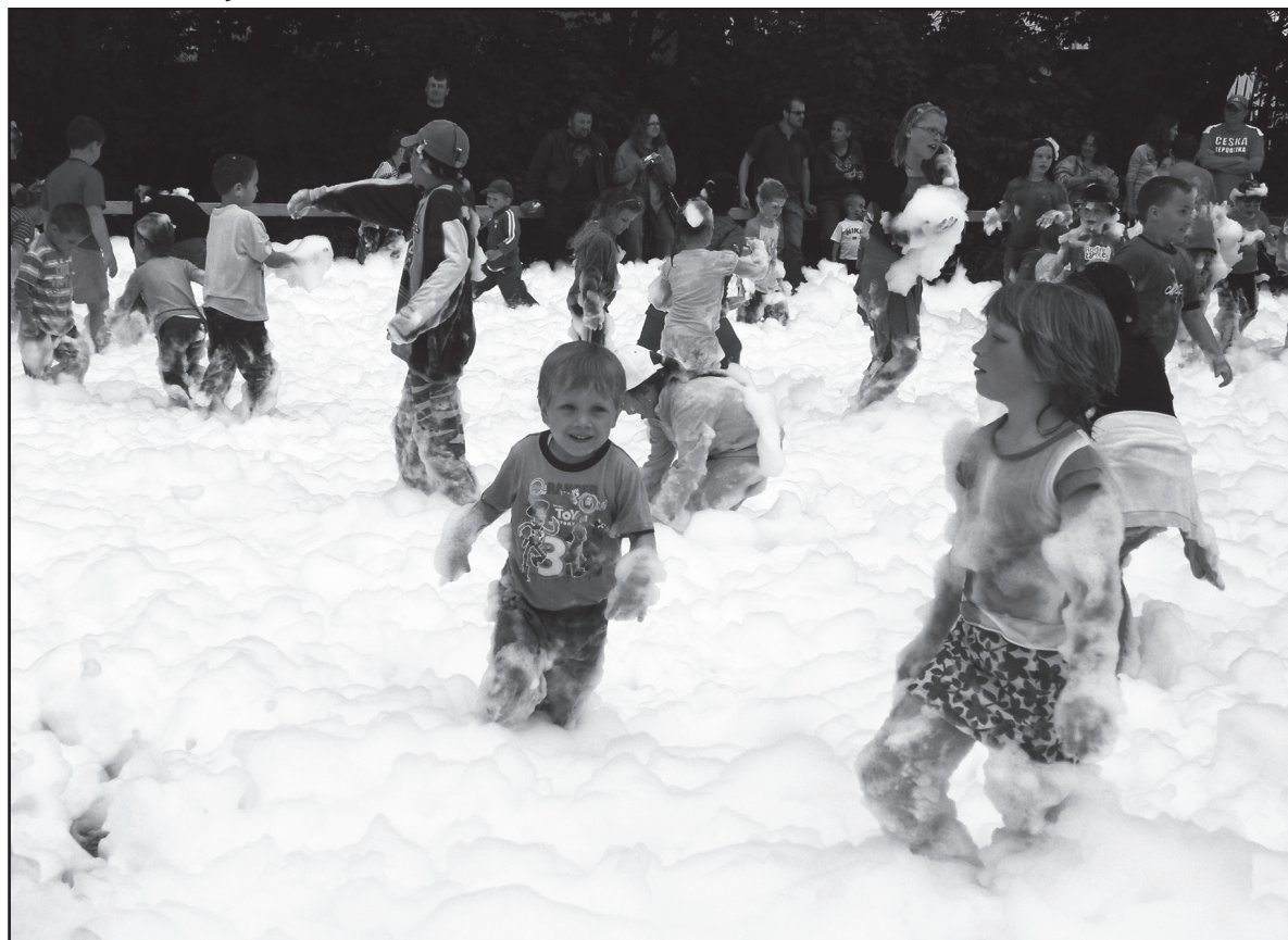
Atraktí a soutěží byla pro dětské hosty přichystána celá řada, ale největší ohlas asi vzbudila pěnová lázeň, kterou jim na závěr připravili dobrovolní hasiči. Rejdní v ekopěně bylo veselým završením dne.

Dětský den v hasičárně, to byl několikahodinový zábavný program a řada soutěží a kratochvil pro děti. Tímto způsobem si Jirkov připomněl dvacáté výročí založení své bezpečnostní složky – městské policie. A bylo to povedené připomenutí. Přispěla k tomu i přízeň počasí, ale především to podstatné, zájem dětí.