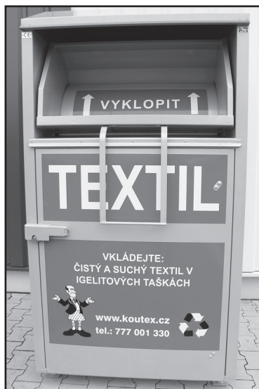
Kontejner na textil najdete i u Tesca.

Dalším problémem, který má vliv na rozšiřování sběrných míst na textilní odpad, je nerespektování účelu kontejnerů. Lidé do nich totiž házejí i papír, sklo, plasty, běžný komunální odpad nebo mokrá a špinavá textil. To všechno je pro projekt KOUTEX nepoužitelné. „Sběrné nádoby na textilní