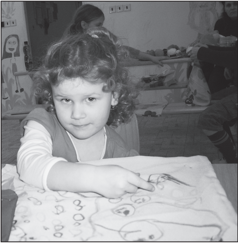
Jak je vidět na snímku, do výroby dárečků se pustili i ti nejmenší z folklorního souboru Jirkovák.

Starší i nejmladší děti z folklorního souboru Jirkovák se věnovaly výrobě dárečků pod stromeček babiček a dědečků v Městském ústavu sociálních služeb v Jirkově. Dárky tvořily už potěť, další přinesli rodiče, příznivci souboru a sponzoři, některé na poslední chvíli děti koupily dětmi prostě proto, že chtěly udělat radost.