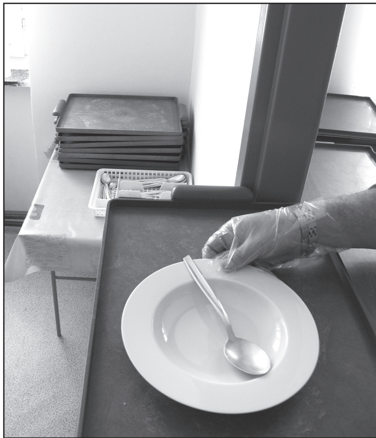
Sociálně slabí mají možnost poobědvat v noclehárně v ul. B. Němcové.

V budově se od začátku roku rekonstruovalo vytápění a ohřev teplé vody, vyměnila se stará okna a balkonové dveře za plastové, celkově se opravila elektroinstalace v bytech, omítky a výmalba. Přibýly nové stupačky, prádelna a sušárna, v bytech jsou také už opravené koupelny a WC, podlahy a kuchyňky a nábytek. Objekt spravuje Městský ústav sociálních služeb