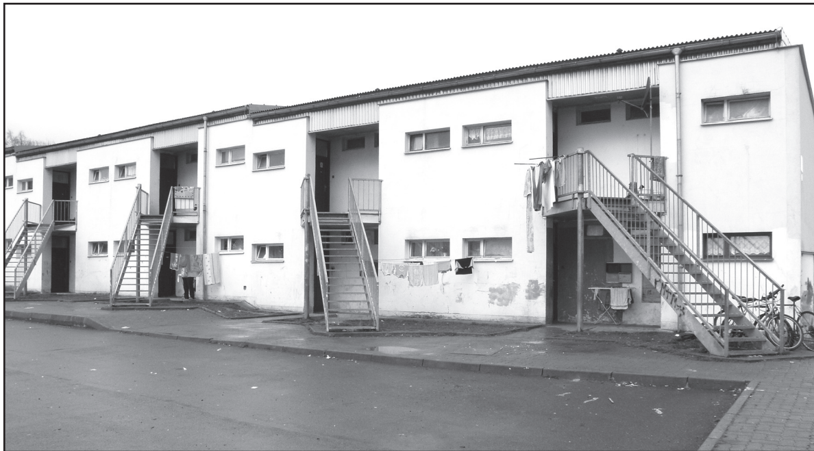
Tady je pro neplatíče v Jirkově konečná stanice - ubytovna za městem poblíž Podniku služeb v Březenci.

Jste si jisti, že nedlužíte nájem, platbu za popelnici, za psa nebo za pokutu od strážníků? Pokud vám přišla poštou upomínka či dokonce už platební výměr, raději co nejdříve zaplaťte. Exekutoři totiž pracují nejen pro Chomutov, ale i pro město Jirkov. Vymáhají například i přeplatky sociálních dávek.