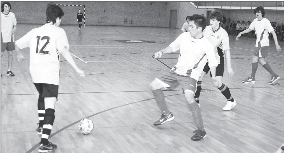
Finálový turnaj o Pohár starosty obce Spořice, zápas FC Chomutov - 1. SK Jirkov.

V závěrečném turnaji Zimní ligy sálové kopané dorostenců obsadili Jirkovští přední místa.