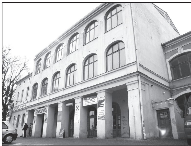
Bývalý klub Beltine - odtud povede tunel do starostova bytu.

Pozitivní postoj mají i náhodně oslovené Jirkovačky: „Radar? No slyšely jsme, že v jeho blízkosti se daří kedlubnám a mrkvi, takže proč ne,“ souhlasí zahrádkářka Celestýna Y. a Vrkošlva X., které zrovna vymýšlely, co na letošek zasadí. Teď už mají jasno.