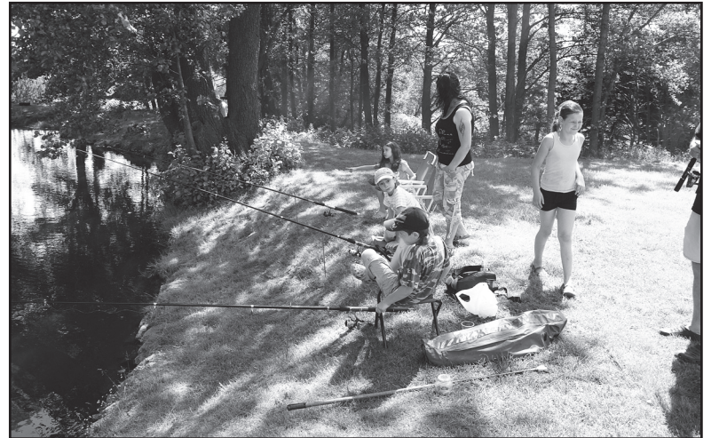
Léto u rybníka neznamená jen koupání: malí rybáři sledují své splávky.

Někteří, zejména menší rybáři, se soustředili na svůj splávek, jiní se u prutu slunili, další asistovali svým ratolestem. Nechybělo občerstvení: pořadatelé nezapomněli ani na to, aby mohl být dodržován – v horku tolik důležitý – pitný režim.