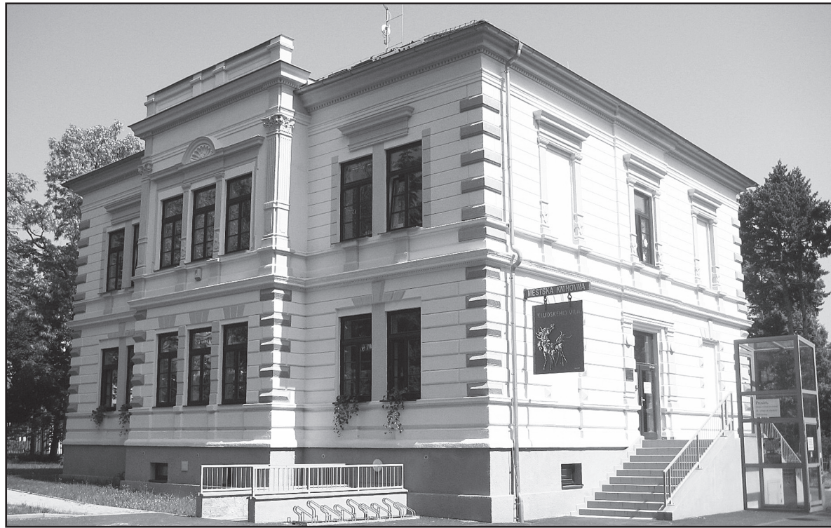
Důstojné sídlo městské knihovny v Kludského vile ve Vinařické ulici.

„Zájem o dobrodružství Harryho Pottera je již minulostí,“ dodává při pohledu na seznam výpůjček vedoucí. Mezi nejvyhledávanější tituly klasické