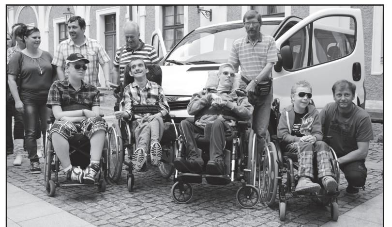
Některé z handicapovaných dětí před novým Opelem Vivaro.