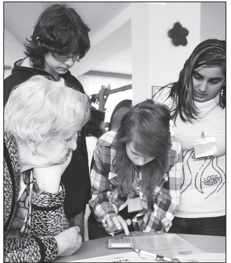
Dali hlavy dohromady - jeden z týmů při početním úkolu.

O peníze šlo v soutěžích především. Na jednom ze stanovišť měli účastníci hádat ceny za vybrané zboží v současnosti a v roce 1989. Cigarety, Pepsi Cola, benzín, ale třeba i dovolená v Bulharsku či nástupní plat středoškola. Tady se uplatnili hlavně senioři, lovili z hlavy vzpomínky na dobu minulou. Žáci totiž byli v týmu vždy s jedním seniorem. „Vzhledem k tomu, že současná mládež moc nevyhledává kontakty se starší generací, měli žáci u nás možnost zkusit si komunikaci se