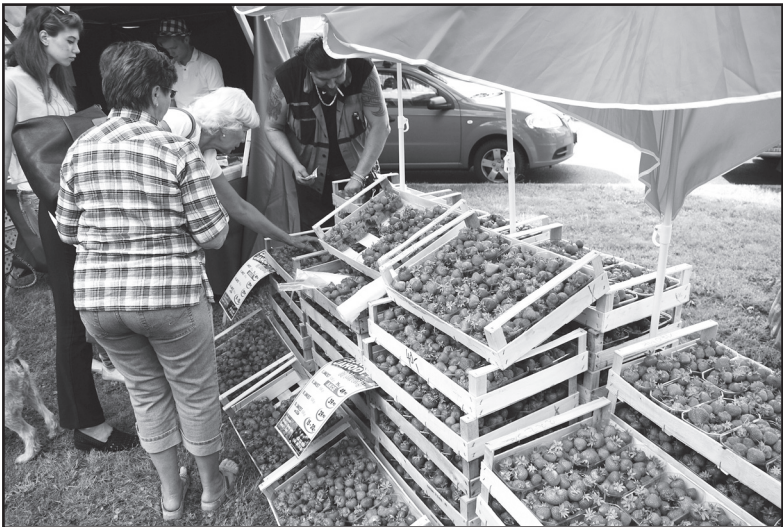
Venkovské farmářské trhy vždy nabídnou pokušení mlsným jazýčkům. Ve Vrskmaňi mezi sýrovými, masnými a sladkými pochoutkami lákaly také jahody.

Vrskmaň – Venkovské farmářské trhy, které pořádá v různých obcích regionu Místní akční skupina (MAS) Západní Krušnohoří, se 23. června konaly ve Vrskmaňi. Ve dvaceti stánkách tu byly k mání zemědělské i rukodělné produkty, hračky, zahradní doplňky a laskominy nejrůznějšího druhu. Nechyběl ani koutek s kratochvílemi pro