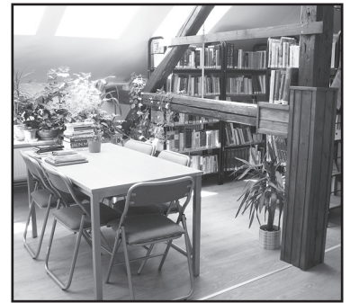
Příjemné prostředí zrekonstruované vily - studovna v podkroví.

První jirkovská knihovna, nejprve lidová, později městská, byla založena v roce 1910. Naprostá většina uložených svazků byla v německém jazyce, což odpovídalo tehdejšímu národnostnímu složení obyvatelstva města - v roce založení knihovny žilo v Jirkově osm Čechů a přibližně pět tisíc Němců.