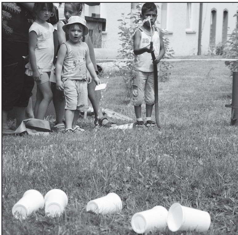
Oblíbená tradiční akce Vítání prázdnin přilákala k hasičárně davy dětí s rodiči. Jedna ze soutěžních disciplín spočívala ve stříkání hadicí na kelímky. Akci podpořilo město Jirkov, pořádal ji Sbor dobrovolných hasičů.