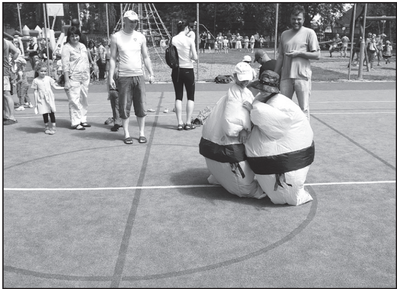
Dvě z méně obvyklých disciplín otvického dětského dne: cosi jako dětské sumo, kdy se malí zápasníci vytlačují z kruhu, navlečení do nafouknutého kostýmu...

Otvice – Dětský den oslavili v Otvicích o dva týdny později, než je uváděn v kalendáři, ale načasování se vyplatilo, akci doprovázelo krásné slunné počasí. Hřiště u požární nádrže zaplnily desítky převážně menších dětí, které plnily různé zábavné úkoly. Za to získávaly u každého stanoviště potvrzení a poté, co absolvovaly sérii deseti disciplín, čekala na ně sladká odměna. Limonáda zdarma přišla v teplém dni a soutěžním vypětí vhod.