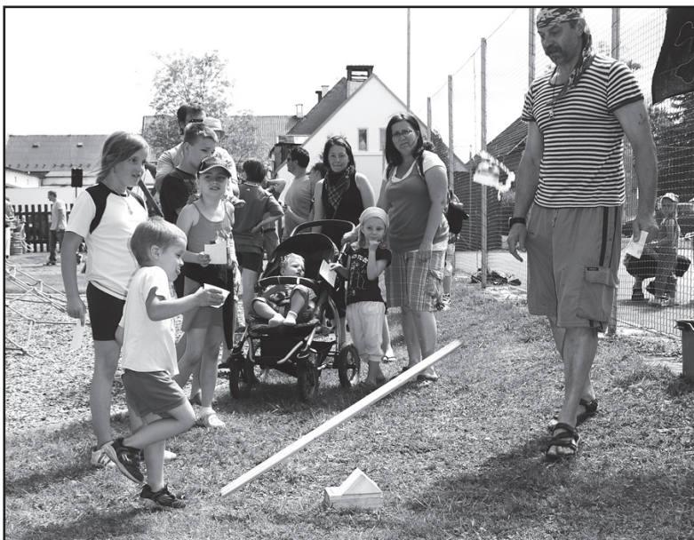
...a vykopnutí kelímku s vodou umístěného na prkně.