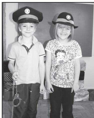
Čepice a pouta v mateřské škole.