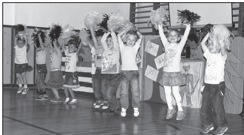
▲ Vystoupení 1. třídy MŠ: Šmoulí samba strhla diváky k bouřlivému aplausu. ► Žádná pořádná olympiáda, tedy ani ta strupčická, se neobejde bez vlajkoslavy a slavnostního nástupu.