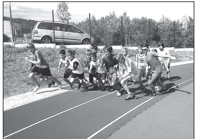
Snímek z poslední části atletického seriálu. Start běhu na 400 metrů jedné z chlapčeských kategorií.

Jirkovská atletická liga, která probíhala od května do června formou čtyř střetnutí, skončila v pátek 21. června závody v bězích na střední tratě. Běhy tak doplnily předchozí závody ve sprintu, skoku do dálky a hodu míčkem a granátem.