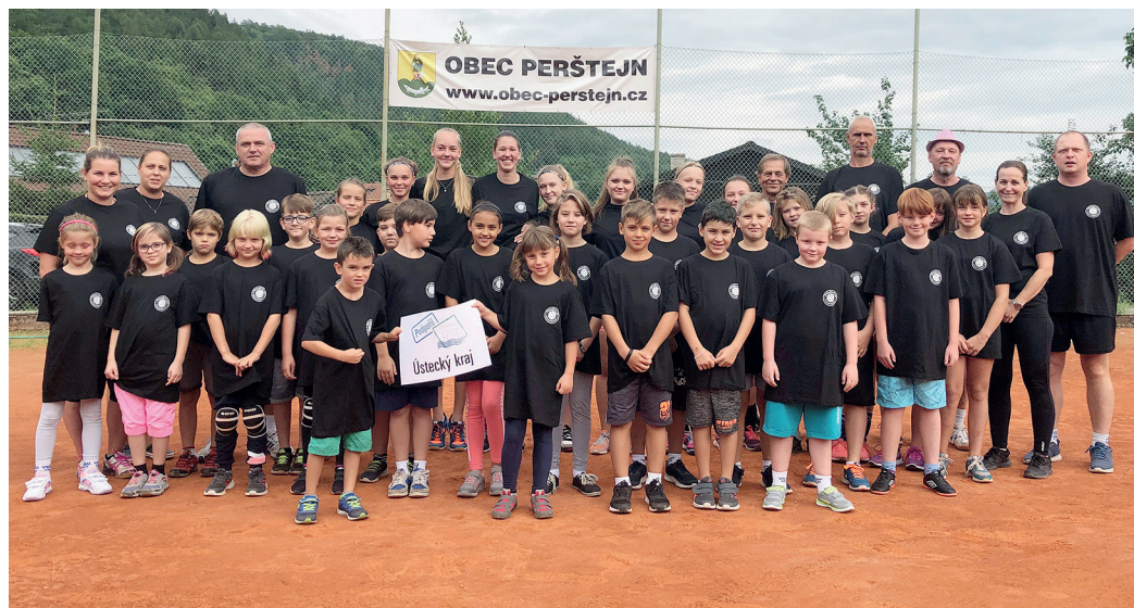
Mládež Volejbalového klubu Jirkov-Ervěnice na nedávném soustředění v Perštejně.