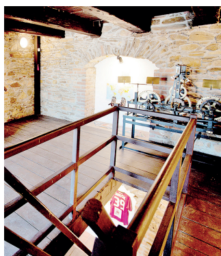
Uvnitř městské věže.