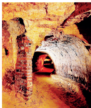
V historickém podzemí.