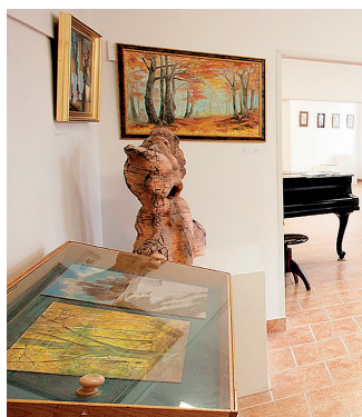
V jirkovské galerii.

ních chodeb, na městskou věž, do kostela sv. Jiljí, na zámek Červený Hrádek a do Galerie Jirkov. (r)