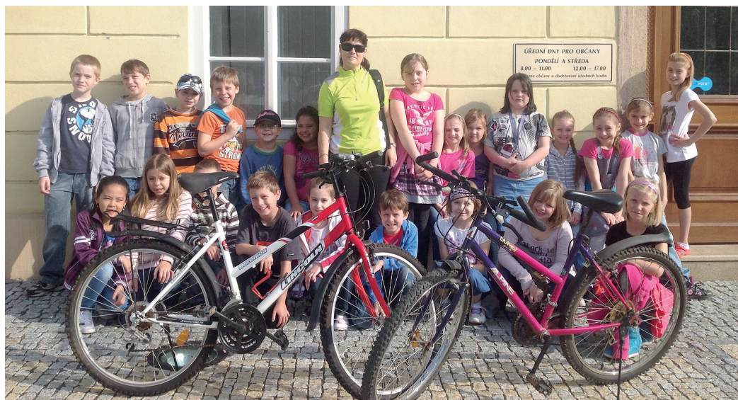
Z první jirkovské sbírky Kola pro Afriku v roce 2013, kdy bylo nashromážděno 49 bicyklů.

přivezená do Afriky podpoří gramotnost, větší možnost pracovního uplatnění i zvýšení občanského statusu tamních obyvatel. (r)