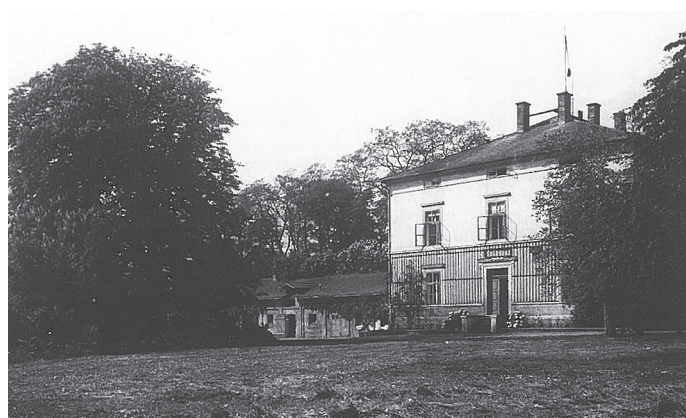
Zemědělské učiliště v 50. letech. Reprofoto P. Tráška: Proměny Jirkova

Třetí část výběru textů se věnuje školství ve 40. a 50. letech.