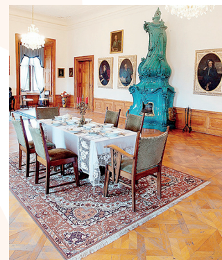
Na zámku Červený Hrádek.