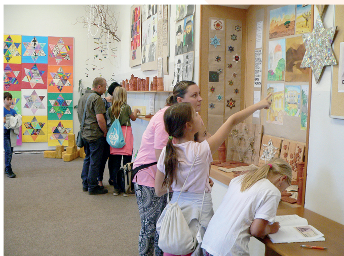
Jedna z výstav děl výtvarníků na téma věnované jirkovské synagoze.

V novém školním roce čeká jirkovský výtvarný obor opět spousta práce. Na podzim je plánována výstava s názvem 'Kapky - Prameny - Oceány' a soutěž Jirkovská paleta má před sebou 28. ročník. Pro výtvarníky už je připravené nové téma: Vodní hlubiny . Bude se též chystat Jirkovský advent 2019 a vánoční výstava, která se ponese v duchu betlémského světla. (iŠ)