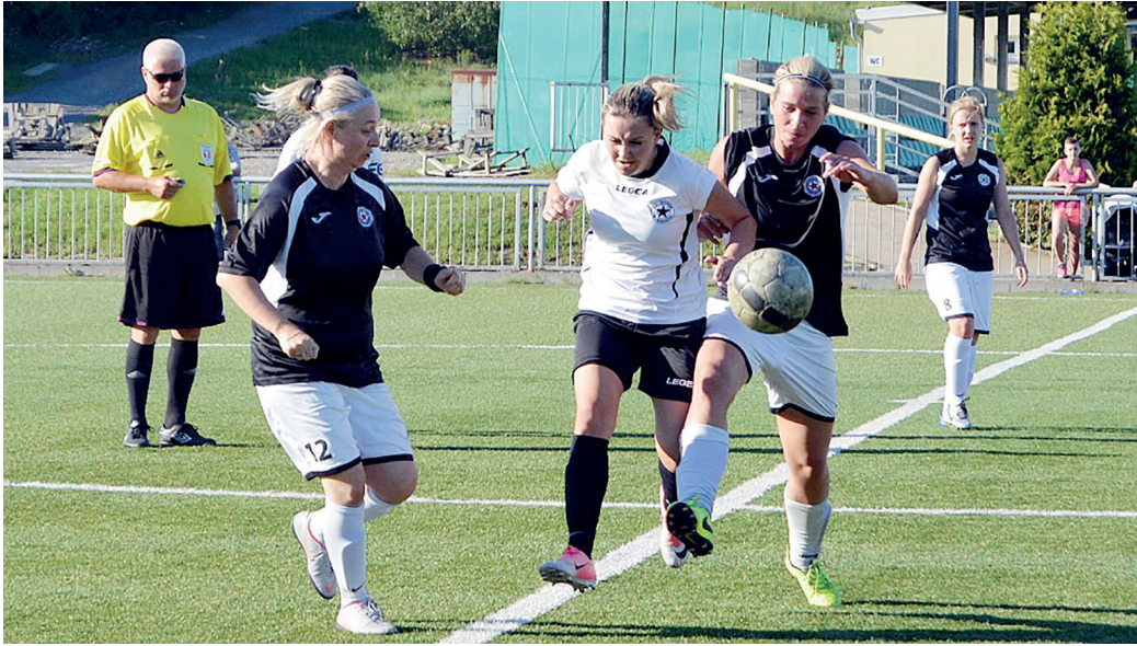
Jeden ze zápasů jarní části soutěže, kde fotbalistky společného týmu bojovaly o mistrovské body.

Sdružený tým fotbalových žen FK Baník Souš a SK Ervěnice-Jirkov zvládl i jarní část soutěže nad očekávání a stal se vítězem divizní skupiny A.