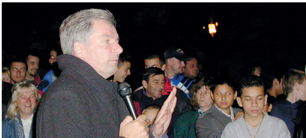
Republikán Miroslav Sládek byl v Jirkově vícekrát. Jeden z jeho večerních mítinků na náměstí Dr. E. Beneše.

Politické půtky v Jirkově však v roce 1993 překonala mnohem závažnější událost. 8. února zasáhla na týden Jirkov a celé Podkrušnohoří nejhorší smogová kalamita v historii vůbec. V zeleném šeru se město topilo celý týden.