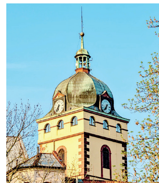
Městská věž, ve které jsou zvony zavěšeny.

Zvonů z 15. století je na našem území dochovaných více a vždy se jedná o vysoce cenné památ-