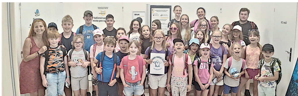
Jirkovští účastníci příměstského tábora na návštěvě v Přírodovědném centru v Žatci.

Letošní tábory využije více než 200 dětí. Ty, které byly v minulém