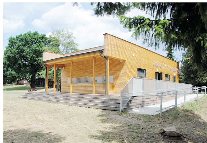
Už rok dobře slouží červenohrádeckému koupališti nové hygienické zázemí autokempu. Jeho výstavba, do níž se město pustilo, zlepšila komfort návštěvníkům. Jedná se o dřevostavbu se zastavěnou plochou 180 metrů čtverečních. Objekt se sprchovými kabinami, toaletami a umývadly je až pro 50 žen, 90 mužů a jednu invalidní osobu.

Nájemce koupaliště a přilehlého autokempu požádal o navýšení částky (o 145 200 korun) především kvůli výraznému zdražení bazénové chemie. (vac)