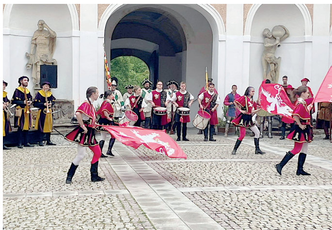
Jedno z historických vystoupení na zámeckém nádvoří.

Poslední červencovou sobotu se na Červeném Hrádku konala Zámecká noc. Opět nabídla bohatý program v historickém duchu. Na nádvoří a v přilehlém parku se o přízeň návštěvníků ucházeli praporečníci, šermíři, kejklíři, tanečnice, sokolníci, trubači, vyhrá-