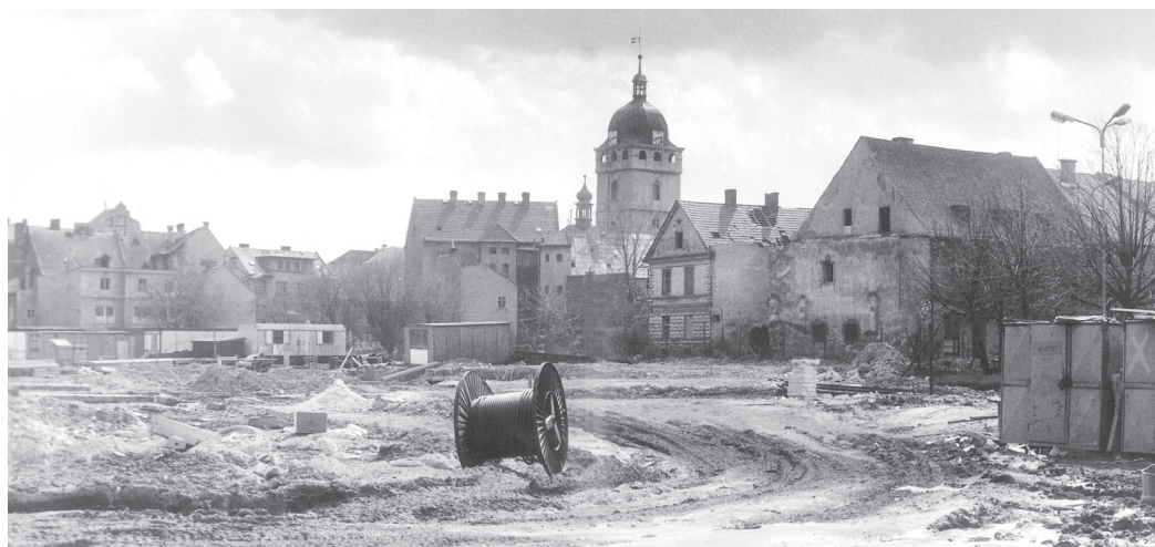
Bláto, anebo prach. Po celé jedno desetiletí. Centrum Jirkova v dubnu 1987.

Město proti alkoholismu občanů bojovalo celé desetiletí jako s větrnými mlýny, požívání desti-