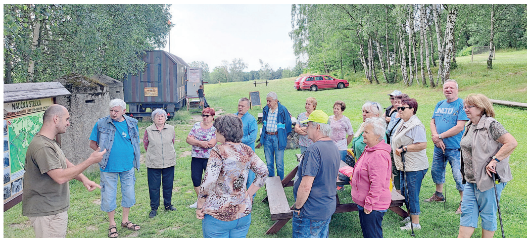
„Civilkáři“ na výletě na Kočičáku, kde je Muzeum československého opevnění z let 1936–1938.

Po občerstvení, které pro nás přichystali, jsme se seznámili s důvody, proč se toto opevnění začalo stavět. Bylo to zajímavé a poučné vyprávění. Také jsme se podívali, jak to vypadá v bunkru – řopíku. (mt)