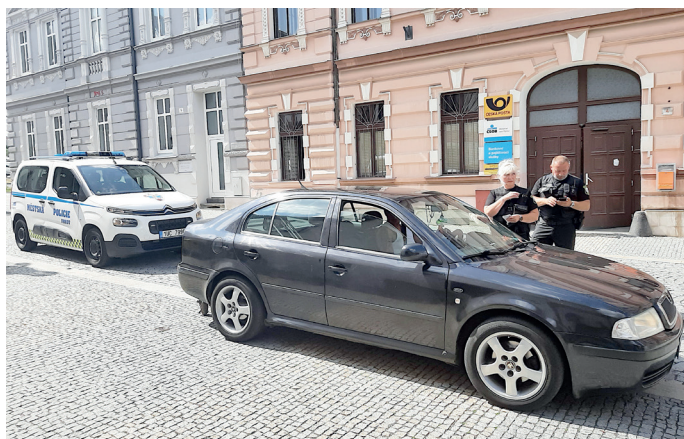
Strážníci řeší přestupek jednoho z řidičů, který vjel neoprávněně se svým vozidlem na pěší zónu.