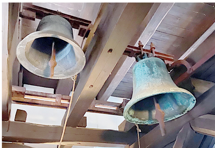
Malý zvon z roku 1918 a velký z 15. století.

ky a doklady zvonařského umění v minulosti. Jen za 2. druhé světové války bylo z Čech a Moravy odvezeno 12 tisíc zvonů a zpět se vrátil jen zlomek tohoto počtu. Zvony mají kromě ceny kovu hlavně vysokou historickou hodnotu jako dokument doby a umění našich předků. Ostatně nemáme mnoho jiných předmětů, které provázejí život člověka v prakticky nezměněné podobě po několika staletí... (vac)