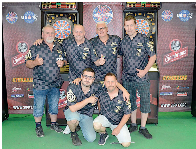
Jirkovský Dream Team Tornádo jako účastník letošního finále Mistrovství České republiky družstev kategorie A v Králíkách.