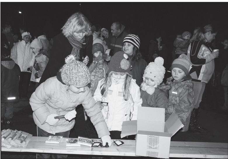
...mohl jít ke stolku, kde byly dobrůtky připraveny. No jo, ale co si vybrat?

Ale pěkně od začátku, protože příchod Mikuláše byl až vyvrcholením onoho svátečního večera. Hned počát-