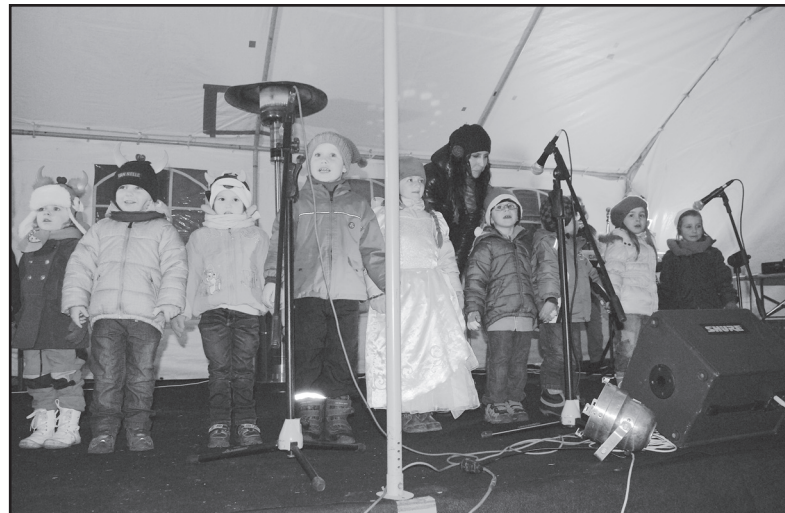
K oblíbené části programu patří vystoupení malých zpěváků.

Vydařený podvečer, který do vsi přinesl svátečního ducha, byl zakončen jako obvykle ohňostrojem, a pak už se stovky Strupčických vydaly do svých domovů. A možná, že pod vlivem atmosféry se už ten den někde chystaly dárky... (lm)