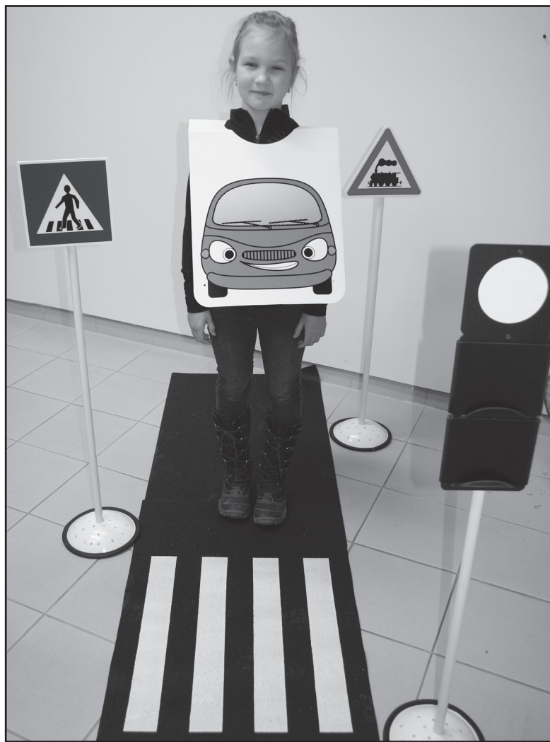
Figurantka Veronika zapožívala při první veřejné zkoušce

S výukou za použití nové pomůcky začala městská policie v prosinci, postupně zavítá na všechny mateřské a základní školy v Jirkově. (ed)