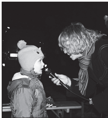
Kdo předvedl básničku či písničku na mikrofon, dočkal se sladkosti...

Otvice – Proud aut, který téměř nepřetržitě rozděljuje Otvice na dvě části, se v neděli 1. prosince v podvečer na chvíli zastavil. Bylo totiž potřeba dát přednost pohádkovému povozu – k vánočnímu stromu v centru obce přijelo koňské spřežení. Ono to vlastně bylo takové spřeženíčko, táhl ho párek poníků a tomu odpovídaly i rozměry vozu. To hlavní, sladké dárky pro děti, se tam ale vešlo. A hlavně: vůz doprovázela známá trojice - Mikuláš s andělem a čertem. Ti všichni se po chvíli, kterou si čert vyhradil pro pouštění hrůzy, pustili do rozdávání dáreků.