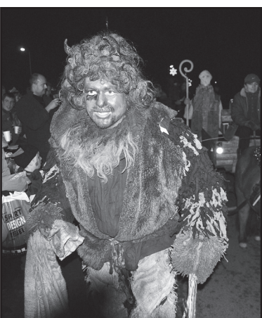
Čert byl vystrojen a nalíčen opravdu působivě, ale jak se ukázalo, byl to, jak už čeští čerti bývají, vlastně dobrák.

Poté, co z Mikulášova „kočáru“ většina sladkostí zmizela mezi caparty, nadešla chvíle, kdy malí i velcí si mohli společně vydechnout: jééé. Od té chvíle rozsvícený stromek kolemjdoucím stále připomíná, že Vánoce přijdou opravdu už za pár dní... (lm)