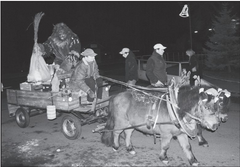
Už jedou! Mikuláš s andělem a čert na voze plném pamlsků.

Otvice – Proud aut, který téměř nepřetržitě rozděljuje Otvice na dvě části, se v neděli 1. prosince v podvečer na chvíli zastavil. Bylo totiž potřeba dát přednost pohádkovému povozu – k vánočnímu stromu v centru obce přijelo koňské spřežení. Ono to vlastně bylo takové spřeženíčko, táhl ho párek poníků a tomu odpovídaly i rozměry vozu. To hlavní, sladké dárky pro děti, se tam ale vešlo. A hlavně: vůz doprovázela známá trojice - Mikuláš s andělem a čertem. Ti všichni se po chvíli, kterou si čert vyhradil pro pouštění hrůzy, pustili do rozdávání dáreků.