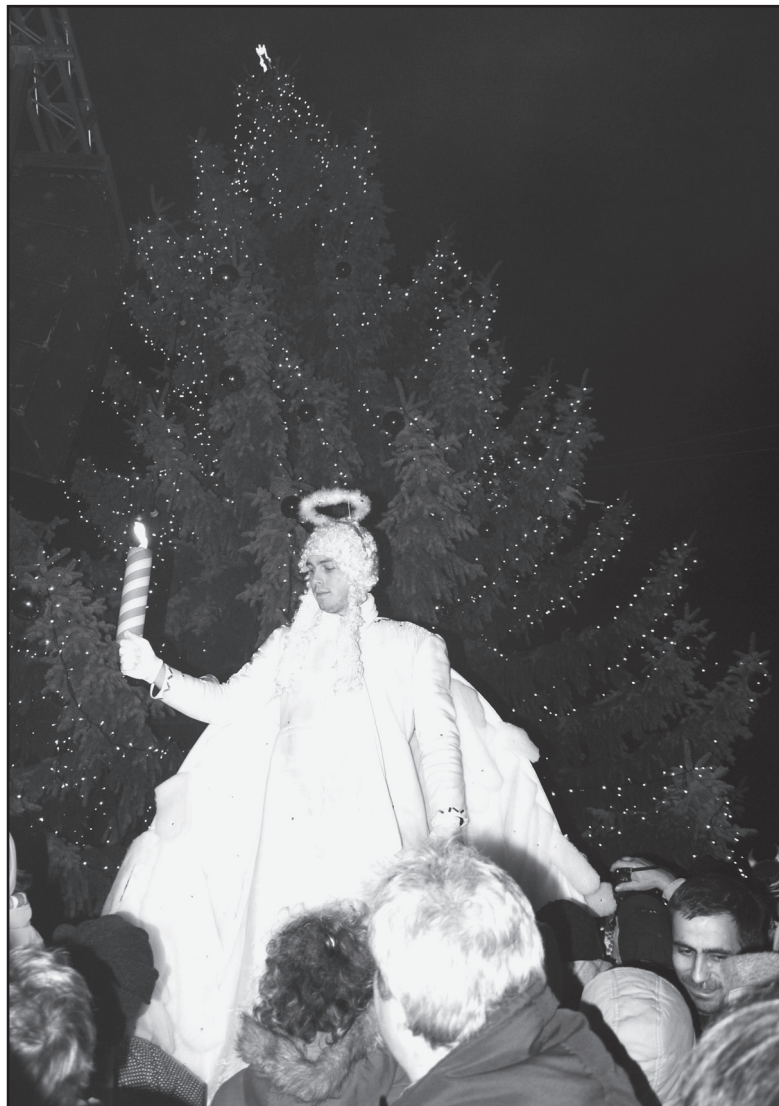
Strom rozsvítila 5. prosince kometa, přivolaná andělem.