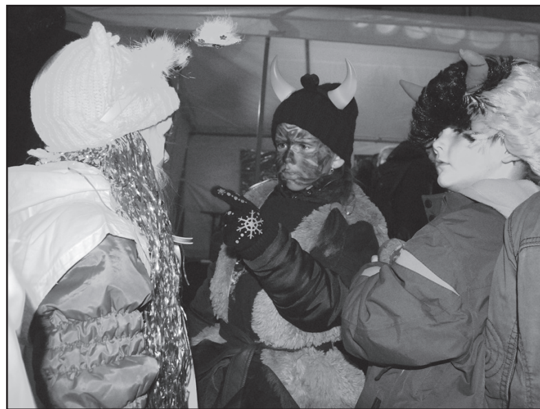
Malými i většími čerty se to na návsi jen hemžilo. Třeba tenhle vypadá dost výhružně. Že by se mu nelíbil ten anděl nalevo?

Zájem o tuto akci vzrostl i mezi jejími dětskými účastníky. „Měli jsme připraveno sto třicet adventních kalendářů s čokoládovými bonbony, ale když jsem děti počítal, došel jsem k tomu, že jich bylo kolem dvou set,“ uvedl