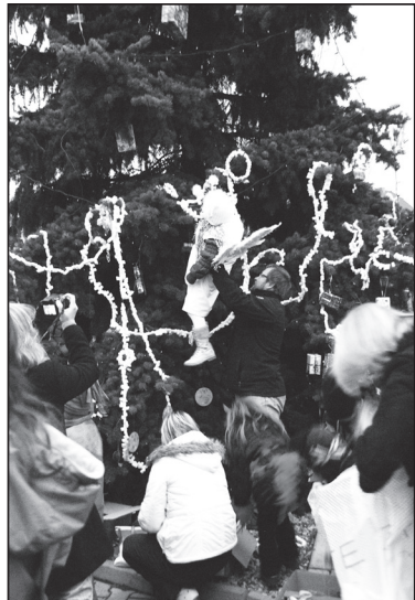
O výzdobu stromku se postaraly děti, když nedosáhly, pomohli dospělí.

starosta Pěnkava. „Muselo jich tu být i dost na návštěvě. Ale dá se to pochopit. V naší škole a školce máme přes dvě stě dětí, včetně přespolních, a tak zřejmě dorazily i ty z okolí.“ Vzhledem k počtu dětí museli organizátoři rozdávat kalendářů upravit. „Chtěli jsme, aby se dostalo především na ty nejmenší, a tak jsme je rozdávali podle věku. Když jsme se dostali ke zhruba desetiletým, byly pryč.“