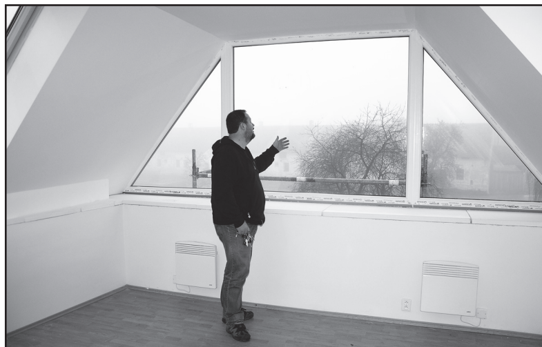
Atypické okno v průčelí nový prostor prosvětluje, říká starosta Hora.

Vrskmaň – Rekonstrukce budovy obecního úřadu ve Vrskmání, kde sídlí také místní knihovna, měla být hotovo do konce roku. Kvůli problémům s dodavatelskou firmou se ale termín nepodařilo dodržet.