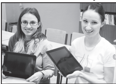
Studentky i jejich spolužáci měli z tabletů radost.

Devatenáct studentů prvního ročníku jirkovského gymnázia dostalo v polovině prosince tablety. Sloužit jim budou po celou dobu studia až do maturity, především ke komunikaci s pedagogy a podpoře výuky. Pomůcku pro gymnazisty podpořila Vršanská uhelná a. s., tabletů má škola díky ní celkem 30, takže