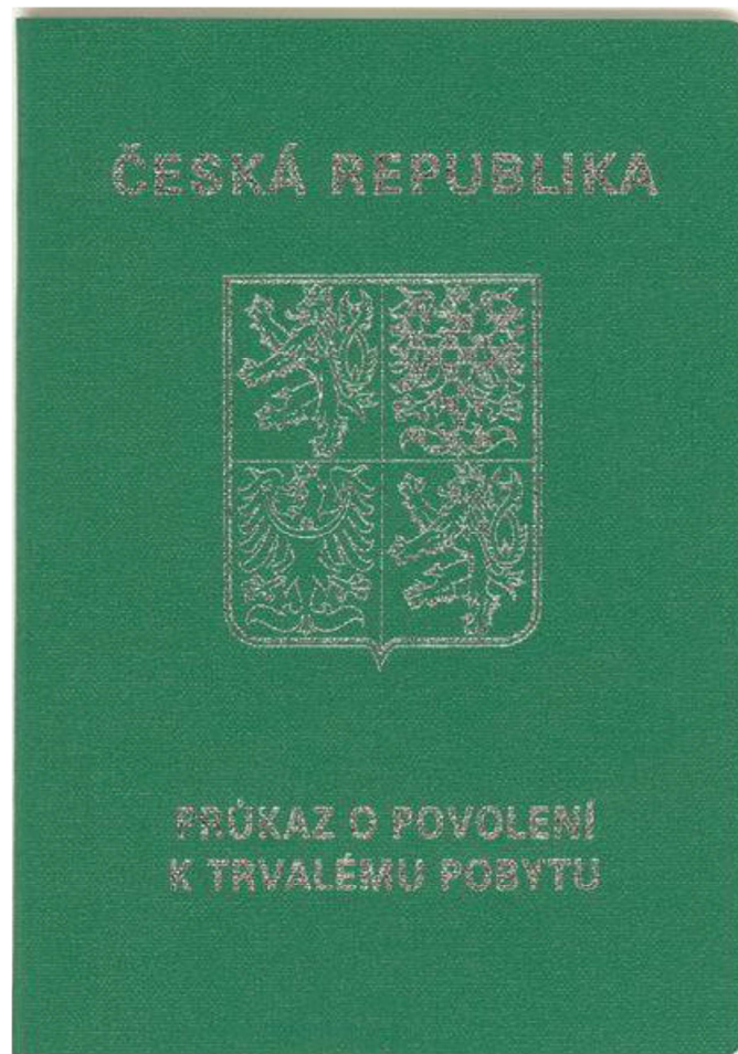
Přední strana dokladu (tmavě zelený doklad ve formě knížky, stříbrný tisk na přední straně)

Doklad je vydáván od 27. dubna 2006 rodinným příslušníkům občanů EU a od 1. ledna 2018 i občanům EU a občanům Norska, Islandu, Lichtenštejnska, Švýcarska a jejich rodinným příslušníkům.