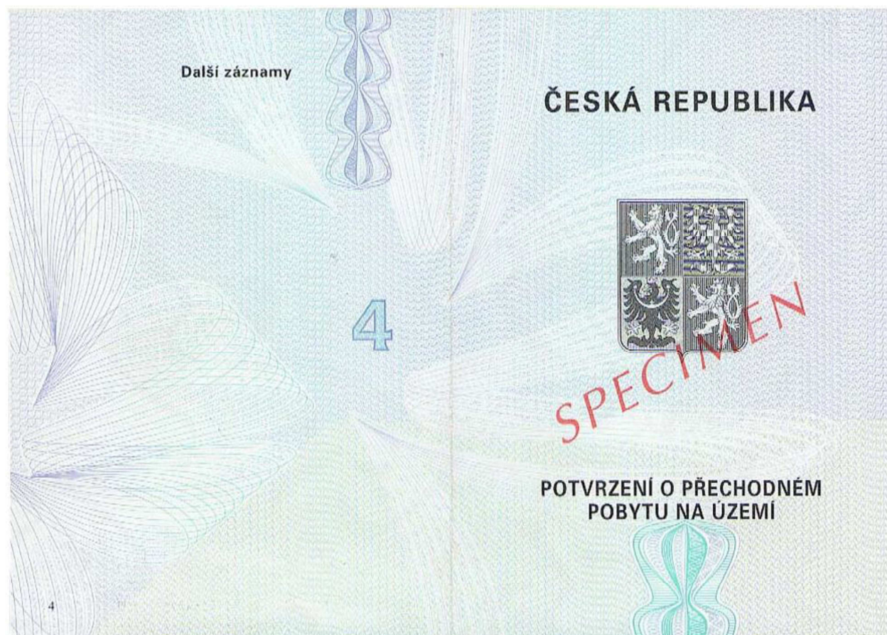
Přední část dokladu (doklad z papíru, přeložen na půl, vzniká doklad o 4 stranách)

Tento model je vydáván od 27. dubna 2006.